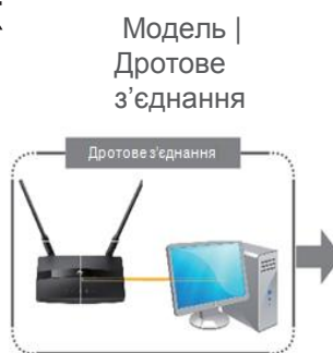
Модель I Дротове з'єднання

Дротове з'єднання призначене для комп'ютерів, не обладнаних бездротовим мережевим адаптером. Бездротове з'єднання призначене для пристроїв, у яких підтримується бездротовий доступ до Інтернету, наприклад для смартфонів та планшетів.